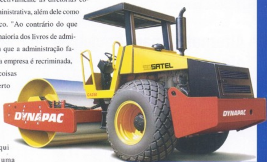
CA 250 - Compactador Vibratório Uma das máquinas disponíveis para locação na Satel

to forte, não há incertezas, portanto, todos tra- balham descompromissados com a vigilância se dedicando ao máximo ao negócio da famí- lia", conclui Same. T&B